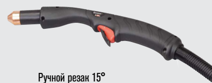
Ручной резак 15°