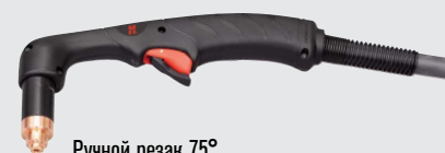
Ручной резак 75°

(дополнительные варианты резаков см. на веб-сайте www.hypertherm.com )